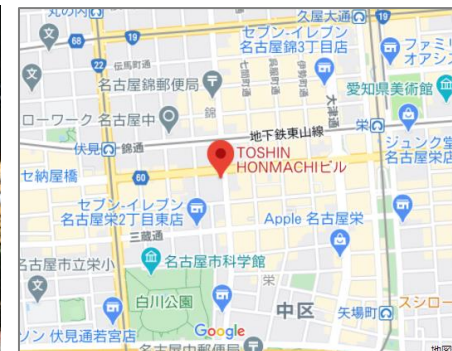
ニッショー栄支店様（広小路本町交差点）を南へすぐ