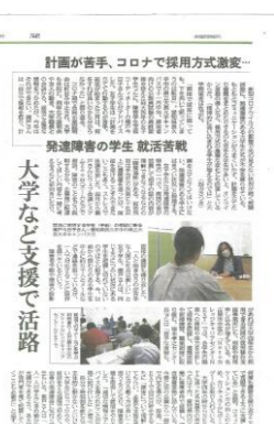
▲ Notoカレッジの障害学生支援における取組が2020年12月に中日新聞で紹介されました